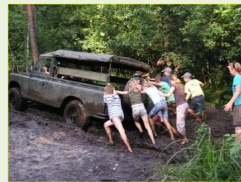
Stacja nr 2

Spływy kajakowe - zachęcamy wszystkich do skorzystania ze spływu kajakowego najbardziej malowniczą rzeką Lubelszczyzny. Podczas spływu czekają na uczestników piękne widoki, malownicze krajobrazy oraz wiele niespodzianek terenowych. Długość spływu, rodzaj trasy dopasujemy do wymagań uczestników.